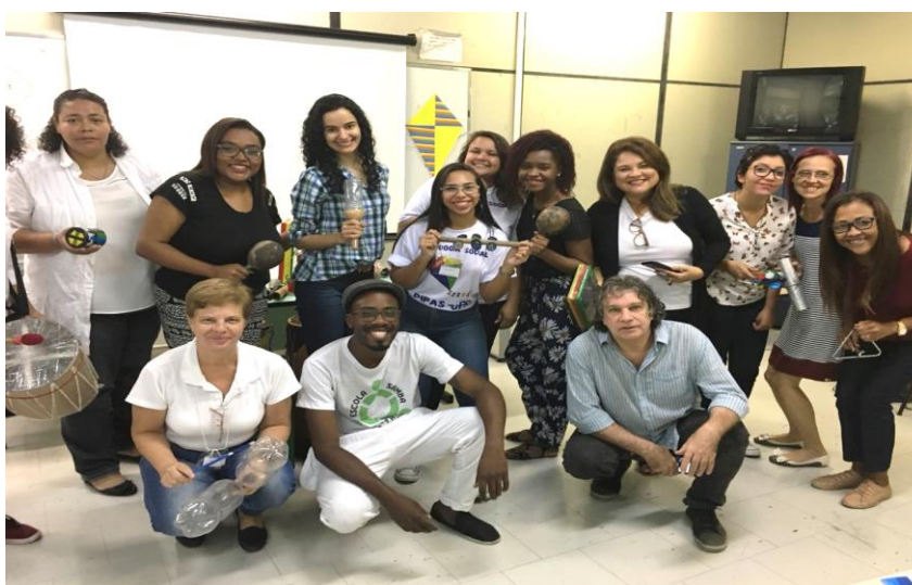
Figura 1: Foto tirada no dia 11 de agosto na oficina de Pedagogia Social e Cultura.

Eu tinha me inscrito para cursar o tema Pedagogia Social e Educação Infantil, contudo, acabou que na hora tive que ficar como monitora de outra sala com tema de Pedagogia Social e Cultura, mas foi uma experiência incrível, eu amei ter “caído de paraquedas” nesse tema, é como dizem por aí, nada acontece por acaso. Esse tema me proporcionou vários conhecimentos como o papel e a importância da cultura. Pude ver que não há sociedade sem cultura do mesmo modo que não há ser humano destituído de cultura. E principalmente que a escola e a cultura são fenômenos intrinsecamente ligados, e juntos tornam-se elementos socializadores, capazes de modificar a forma de pensar dos educandos e dos educadores. Mas para que haja uma parceria entre a cultura e a educação faz-se necessário deixar de lado alguns estereótipos que ainda vaga na mente de alguns educadores e alunos, na qual legitimam como cultura apenas as festa popularmente conhecidas e data comemorativas tradicionais, dessa forma, requer a necessidade de se olhar as demais culturas como uma fonte de riqueza que pode auxiliar no processo de ensino – aprendizagem.