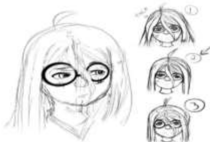
Desenho do aluno

Frustrações, angústias, tristezas, são sentimentos que todo o ser humano deve passar como experiências vividas e superadas, para que num outro momento, ao retornarem com maior ou menor grau, sejam novamente e sempre superadas. Faz parte do ser humano essa roda viva, vivemos de emoções, de sentimentos, de percepções. Devemos como professores estar atentos para que esses sentimentos, emoções e percepções, não destruam o ser que pode estar ao nosso lado, no caso, nosso aluno. Acredito que a escola não está conseguindo trabalhar essa questão. Eis aqui uma das suas produções artísticas: