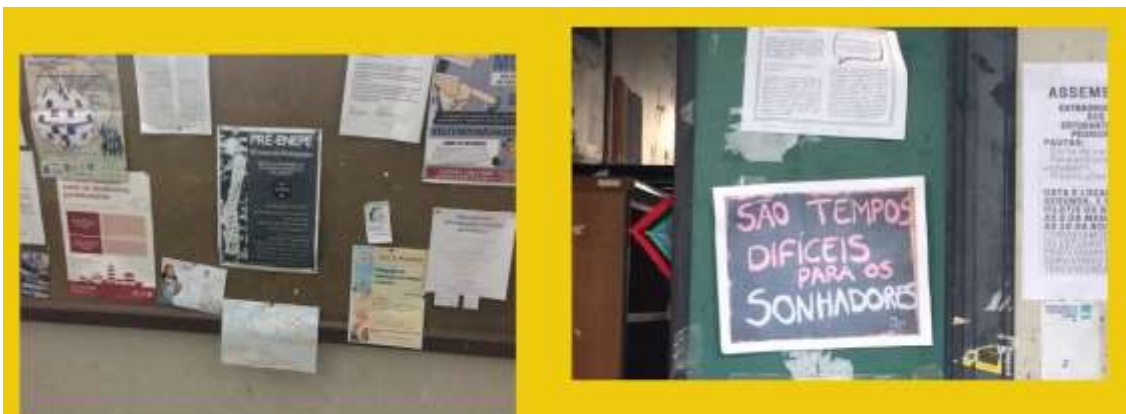
Os cartazes e o impacto da disciplina de Tópicos Especiais em Pedagogia Social