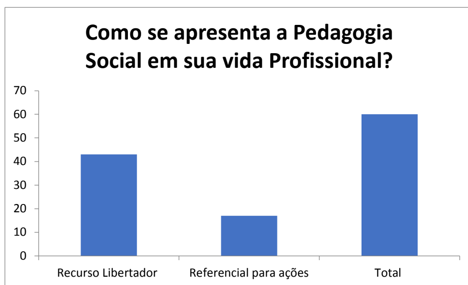
Figura 1: Pergunta do questionário online sobre “ Como se apresenta a Pedagogia Social em sua vida profissional ”

Num mundo globalizado, onde as exigências inclusivas são cada vez maiores, a pedagogia social referencia nossas ações e se apresenta como fator imprescindível para a sobrevivência social e profissional, como recurso libertador do ser humano, que seja capaz de abrir janelas para conhecimentos e portas para oportunidades, como podemos observar na Figura 1: